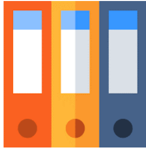
Dokumentacja w formie papierowej